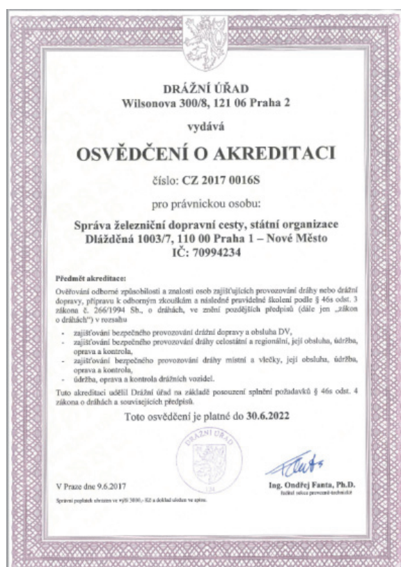
Obr. 3 - Osvědčení o akreditaci

SŽDC získala 9. 6. 2017 Osvědčení o akreditaci pro právnickou osobu od Drážního úřadu.